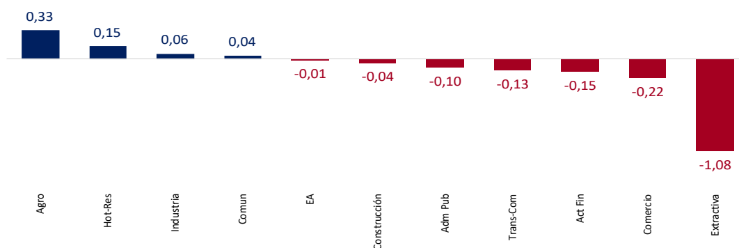
Gráfico N° 3 BOLIVIA: CONTRIBUCIÓN AL CRECIMIENTO ACUMULADO DEL PIB POR ACTIVIDAD ECONÓMICA, ENERO A SEPTIEMBRE 2025 (p) (Puntos Porcentuales p.p.)