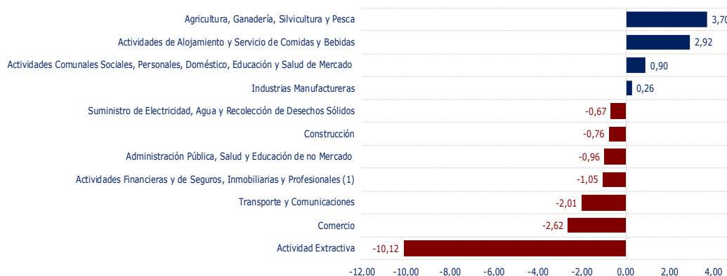
Gráfico N° 2 BOLIVIA: VARIACIÓN ACUMULADA DEL PIB POR ACTIVIDAD ECONÓMICA, ENERO A SEPTIEMBRE 2025 (p) (En porcentaje)